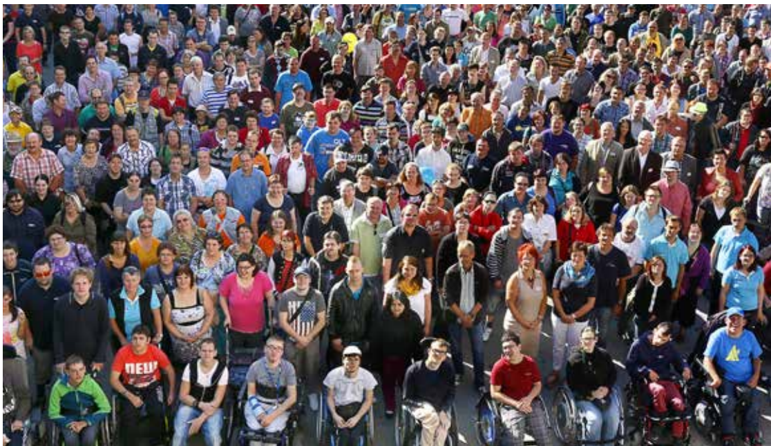
FAB Pro.Work MitarbeiterInnen-Tag 2013