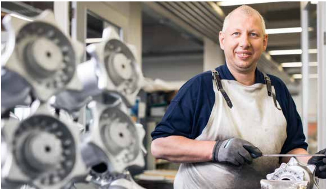
Arbeit soll Freude machen: ein Mitarbeiter von FAB Pro.Work Vöcklabruck