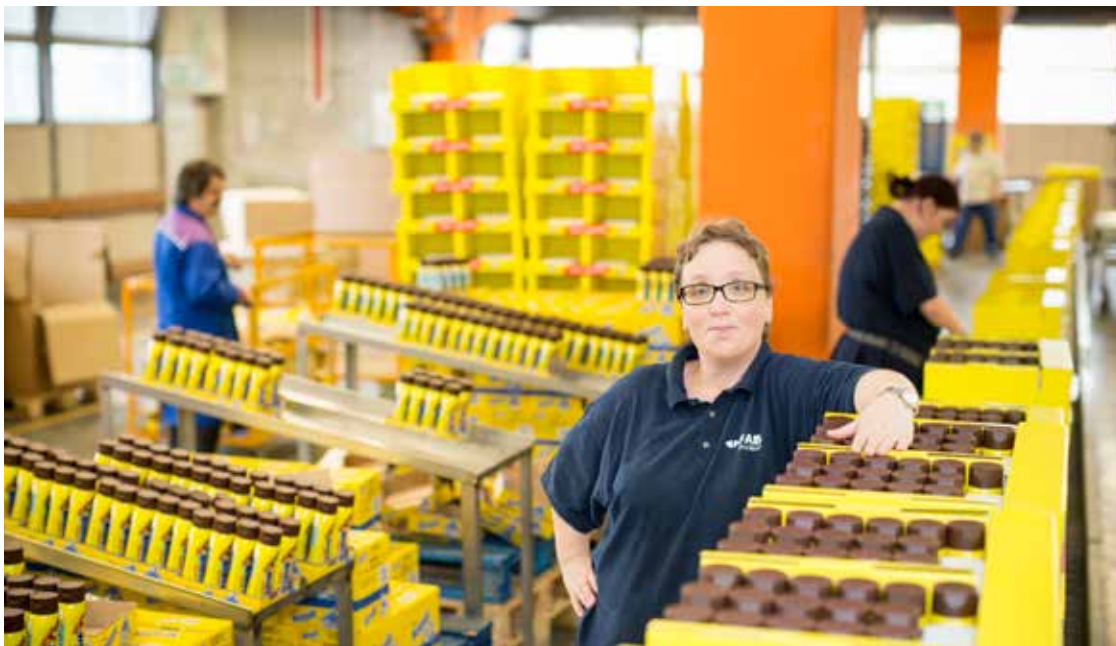
Sorgfalt und Verlässlichkeit sind besonders wichtig (Verpackung, FAB Pro.Work Linz)

Dem individuellen Entwicklungspotenzial unserer MitarbeiterInnen wollen wir so gut wie möglich Rechnung tragen und sie auf Anforderungen der Arbeitswelt, auch des Regelarbeitsmarktes, vorbereiten. ◀▶