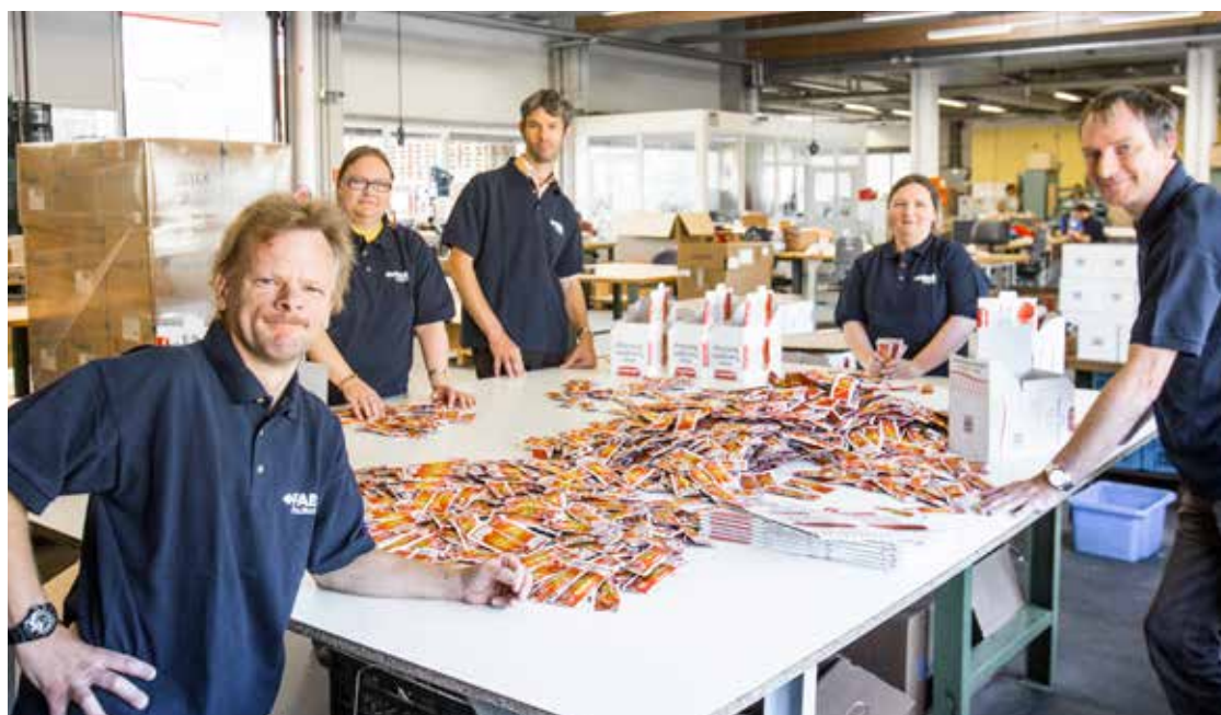
Teamwork ist eine Stärke von FAB Pro.Work

Geschützte Arbeit bei FAB Pro.Work wirkt klar inklusionsfördernd und bietet eine große Bandbreite unterschiedlicher Tätigkeiten, sie trägt der Forderung nach Durchlässigkeit der Systeme Rechnung. Zur Realisierung des Rechts auf Arbeit sind Einrichtungen wie FAB Pro.Work notwendig, da sie die Benachteiligung und Diskriminierung am Arbeitsmarkt ausgleichen. ◀▶