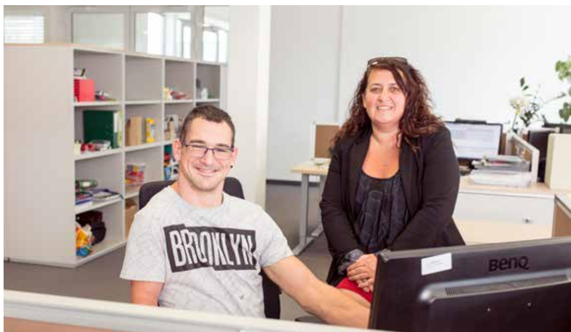
Geschützte Arbeit in Betrieben betreut FAB MitarbeiterInnen in regionalen Unternehmen.

Derzeit arbeiten 190 MitarbeiterInnen mit Beeinträchtigungen bei FAB Pro.Work in anderen Firmen, bis 2017 sind insgesamt 210 Plätze für die betreute Arbeitskräfteüberlassung in Oberösterreich geplant. ◀▶