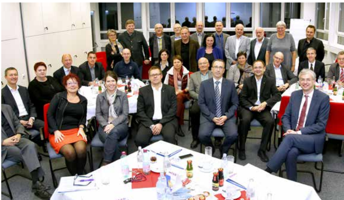
FAB PartnerInnen-Meeting 2014

Über die Auftragsplattform Clevercure sind wir in das Lieferantensystem des Feuerwehrspezialisten eingebunden. Das Unternehmen Rosenbauer hat FAB Pro.Work auch bei der letzten Bewertung wieder als 1A-Lieferant eingestuft. ◀▶