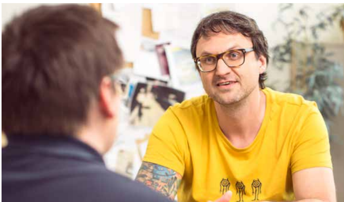
Die Sozialarbeit von FAB Pro.Work unterstützt die MitarbeiterInnen in persönlichen und beruflichen Belangen.

BVP-RepräsentantInnen nehmen regelmäßig an internen Besprechungen und an den Redaktionssitzungen für die MitarbeiterInnen-Zeitung "die INFO" teil. ◀▶