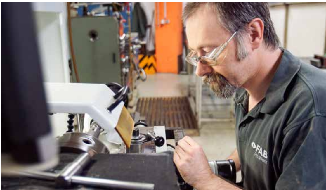
FAB Pro. Work Linz, Metallwerkstatt

Mit unserem Angebot wollen wir unseren MitarbeiterInnen Alternativen und Wahlmöglichkeiten eröffnen und sie in die Lage versetzen, Abhängigkeiten zu verringern. ◀▶