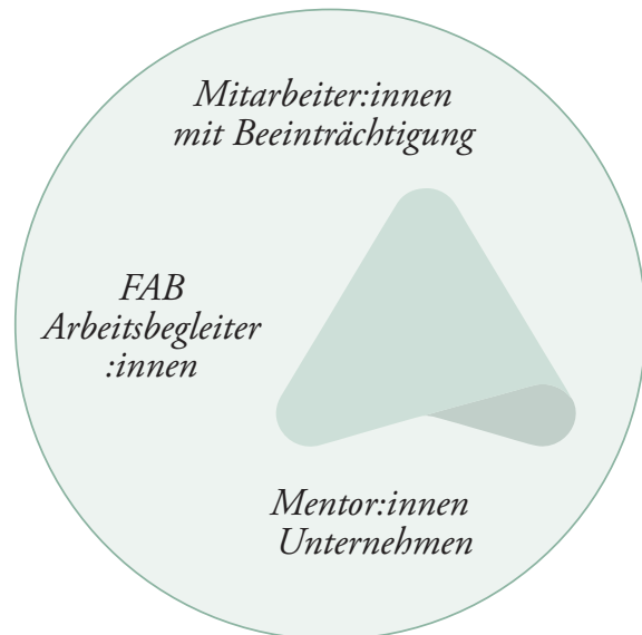
GRAFIK FAB: DAS MENTOR:INNEN-SYSTEM

Die enge Zusammenarbeit zwischen Mitarbeiter:innen, Mentor:innen der Firma und der Arbeitsbegleitung erfordert gegenseitiges Vertrauen und laufende, gute Kommunikation.